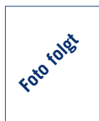
Rainer Voss Vergütungsbeauftragter, State Street Bank

Inhouse-Seminare auf Anfrage ( info@exbase.de )